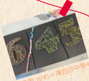
(見圖: 6/45 = 陳白沙中學45週年其中的6年)