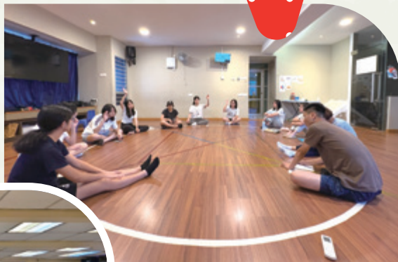
為服事的小朋友作最後準備