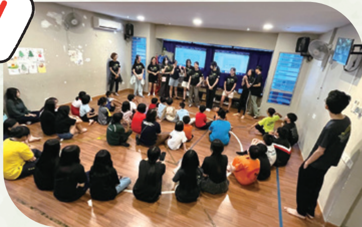
在教會帶領一班小孩子唱詩歌、玩遊戲