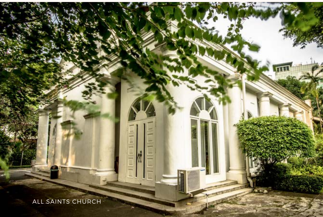
ALL SAINTS CHURCH