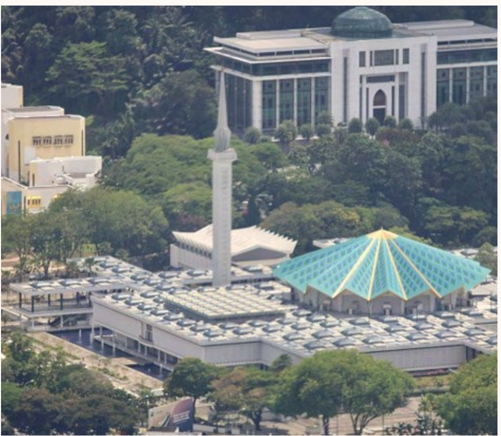
伊斯蘭教是馬來西亞的國教. 圖片顯示的是位於吉隆坡的國家回教堂