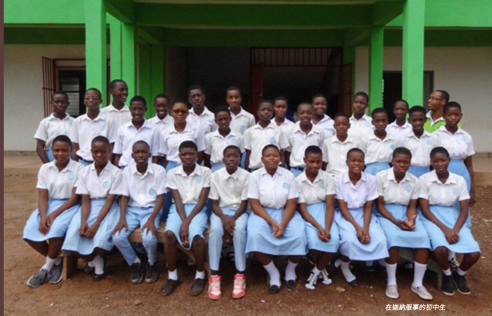
在迦納服務的初中生

我 出生於五十年代香港的一條鄉村，那時的村民都迷信且懼怕鬼神，我自幼聽了不少「鬼故」，對那些神鬼偶像，極度害怕，心裡不平安。