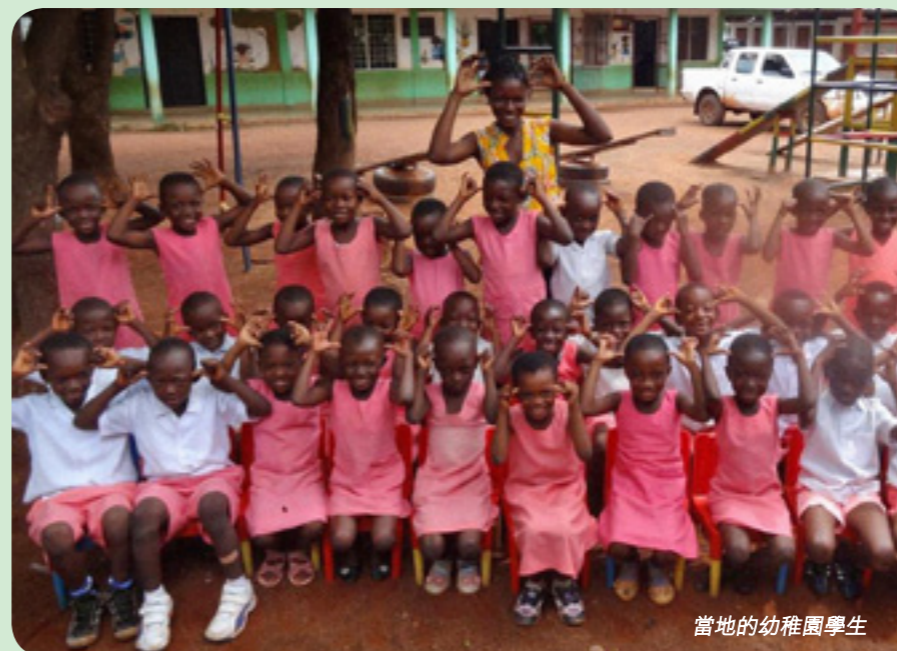
當地的幼稚園學生

30多年過去了，我們都以不同形式的教育和辦學去祝福異文化的群體，雖說是固執地擺上我們人生寶貴的光陰，我們同有希伯來書作者在第十一章13節的感慨：「這些人都是存著信心死的，並沒有得著所應許的；卻從遠處望見，且歡喜迎接，又承認自己在世上是客旅，是寄居的。」但保羅在歌林多前書第十五章58節鼓勵和保證說：「所以，我親愛的弟兄們，你們務要堅固，不可搖動，常常竭力多做主工；因為知道，你們的勞苦在主裡面不是徒然的。」我們期望，在我們之後，有更多的宣教士、本地信徒，為這回教群體，繼續擺上他們，叫這裡的人蒙福。